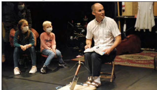
Grâce à leurs créations inventives, le cirque Piètre a su réenchanter un monde désincarné.

De l'âge des cavernes, où le feu crée la mémoire des peuples, au bottin téléphonique en passant par une séance de pop-corn en direct, c'est tout un monde que le cirque Piètre a mis en mouvement à la Nef ce vendredi 2 octobre. Un monde qui joue à la fois sur notre mémoire collective, la magie de nos enfances perdues ou les plongées secrètes dans nos greniers d'antan, propices à l'évasion et à