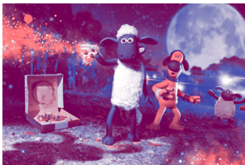
Tout public / Film sans paroles

A Shaun The Sheep movie: Farmageddon When an alien with amazing powers crash-lands near Mossy Bottom Farm, Shaun the Sheep goes on a mission to shepherd the intergalactic visitor home before a sinister organization can capture her.