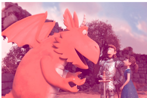
À partir de 3 ans

Zog A keen but accident-prone dragon learns how to become a dragon at Dragon School.