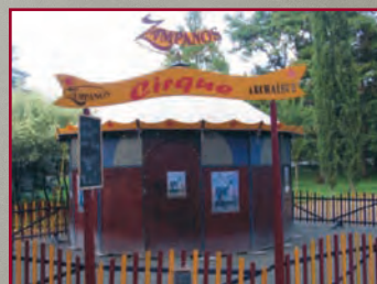
TOULOUSE jardin des plantes juin 2011