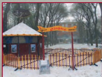
PARIS Square Sorbier en décembre 2010

Cirque ou marionnette, peu importe le genre : ce spectacle mérite bien plus qu'une étiquette. Sur une piste de 1,50m., il prouve qu'avec de petits riens peuvent être exécutés les plus beaux numéros du monde. Les Zampanos n'ont pas l'orgueil au phénix mais l'humilité émouvante. Ils réunissent, en discret hommage au cirque de Calder, artistes faits de fil de fer et de bois avec quelques complices de poils et de plumes (Boudu le chien, Irène la poule et Crakozzz... le rat). Petits et grands, tout le monde succombe à ce joli spectacle, émouvant et poétique, tendre et maladroit, qui réveille des émotions insoupçonnées. A voir sans tarder !