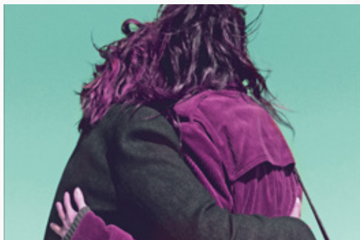
Festival de Cannes 2021