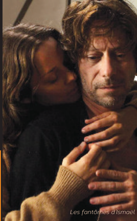
Les fantômes d'Ismaël

67ter, cours National BP 90122 17104 Saintes Cedex Répondeur 05 46 92 20 32 www.galliasaintes.com cinema@galliasaintes.com