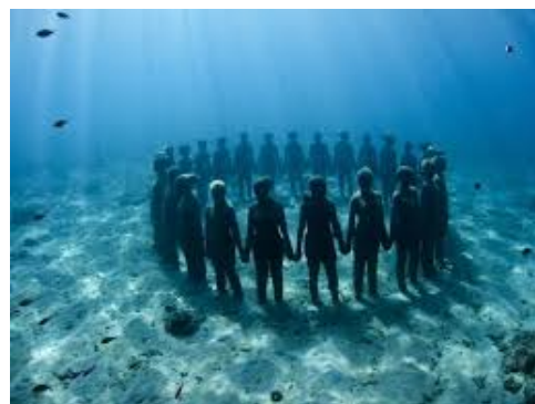
Jason de Caires Taylor, Vicissitudes