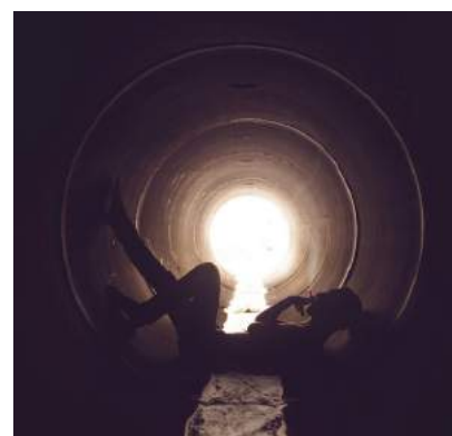
Kyle Thompson / VU', untitled