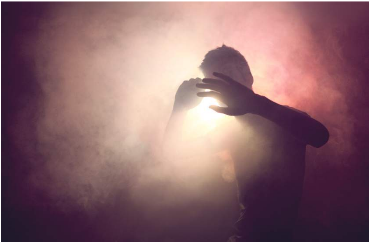
© Kyle Thompson / VU', Pause