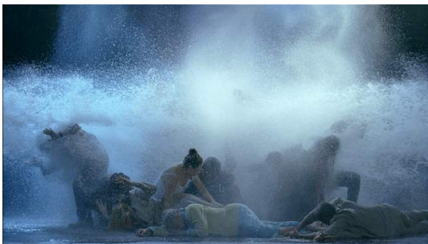
Bill Viola, Study for The Raft